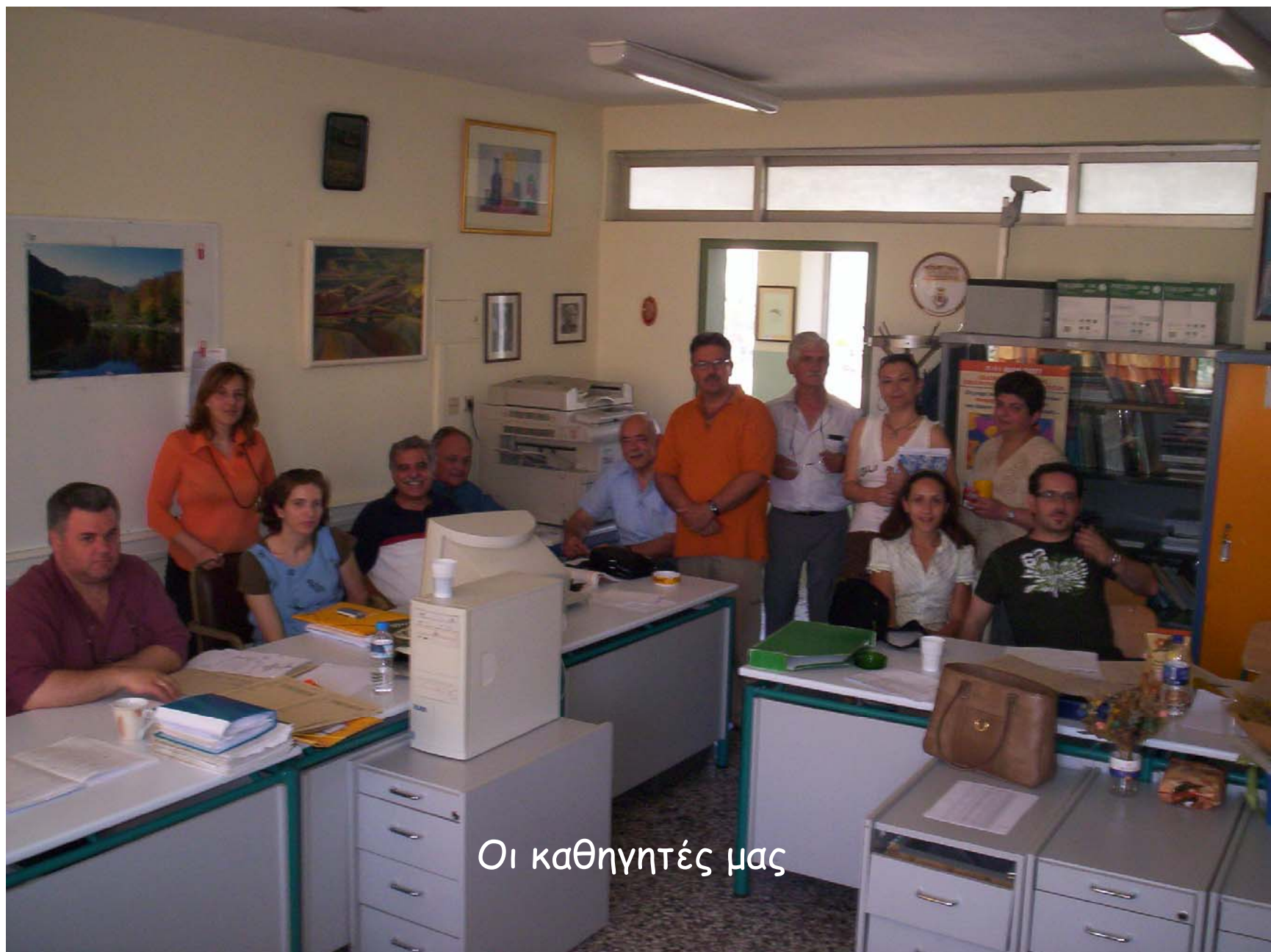
Οι καθηγητές μας