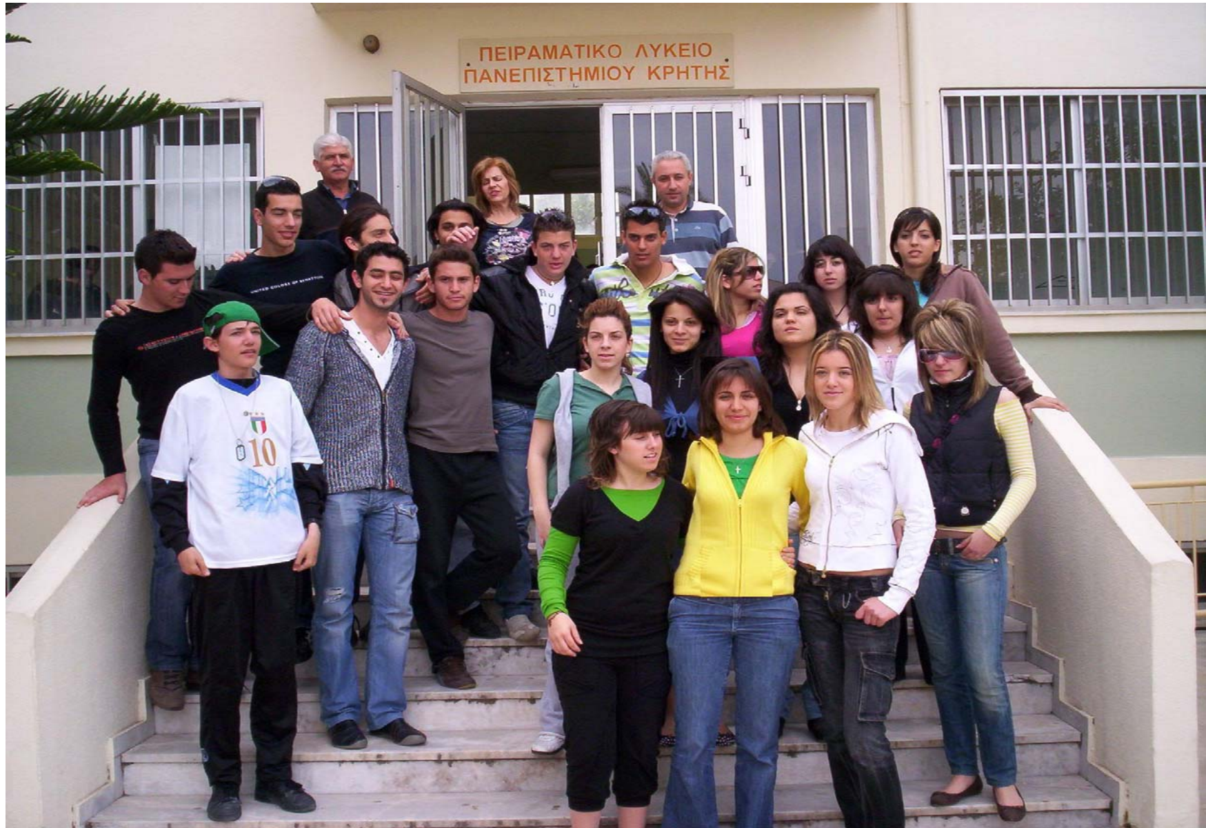
Αναμνηστική φωτογραφία από τα παιδιά του Γ 1.