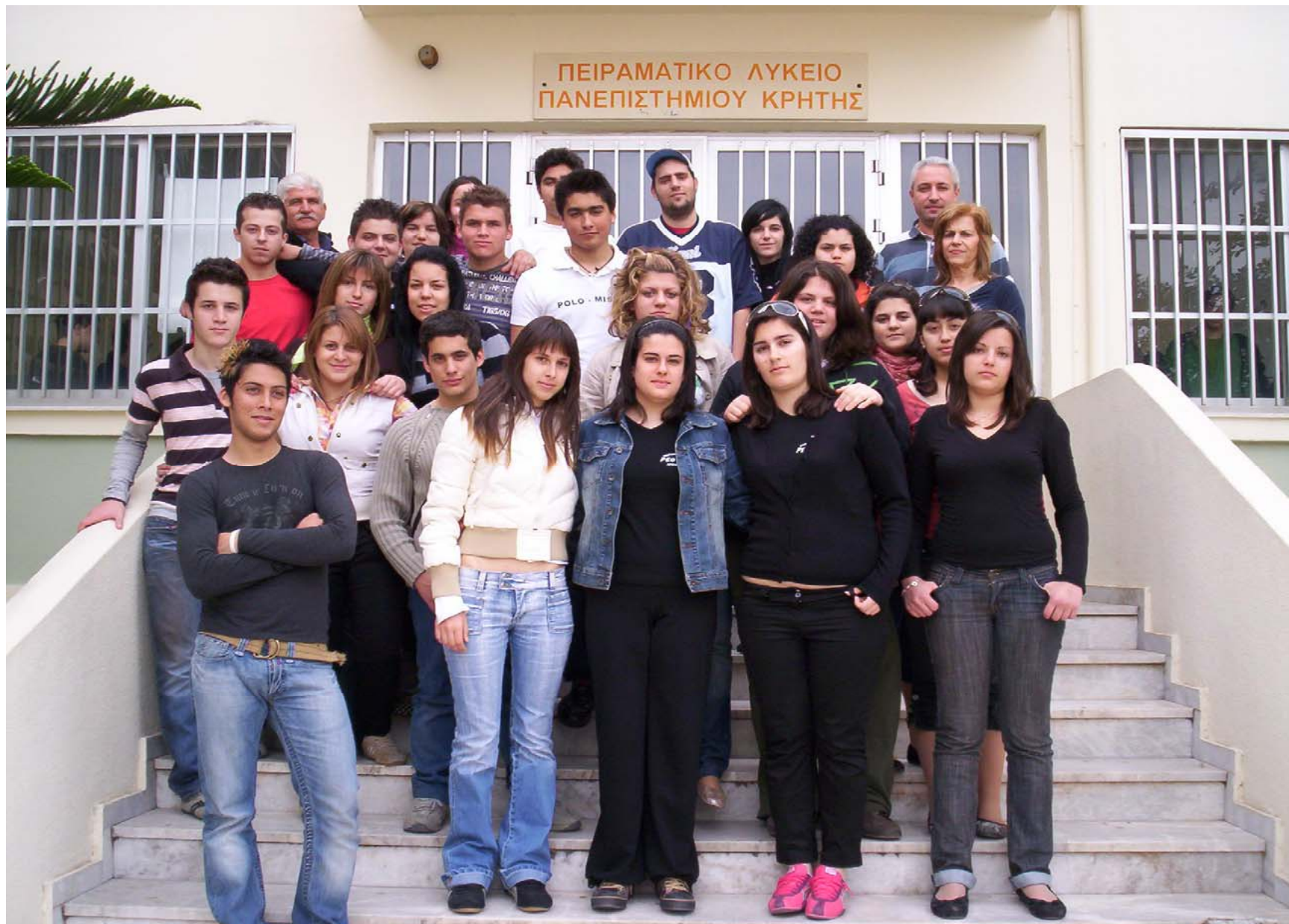
Αναμνηστική φωτογραφία από τα παιδιά του Γ 2.