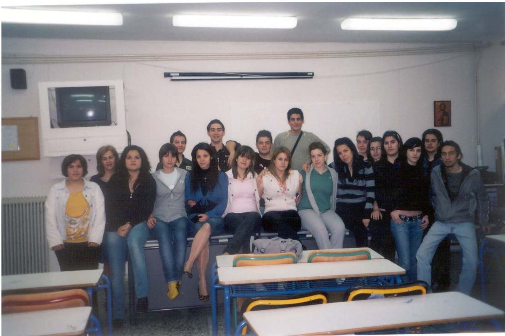
Αναμνηστική φωτογραφία της Θεωρητικής Κατεύθυνσης.