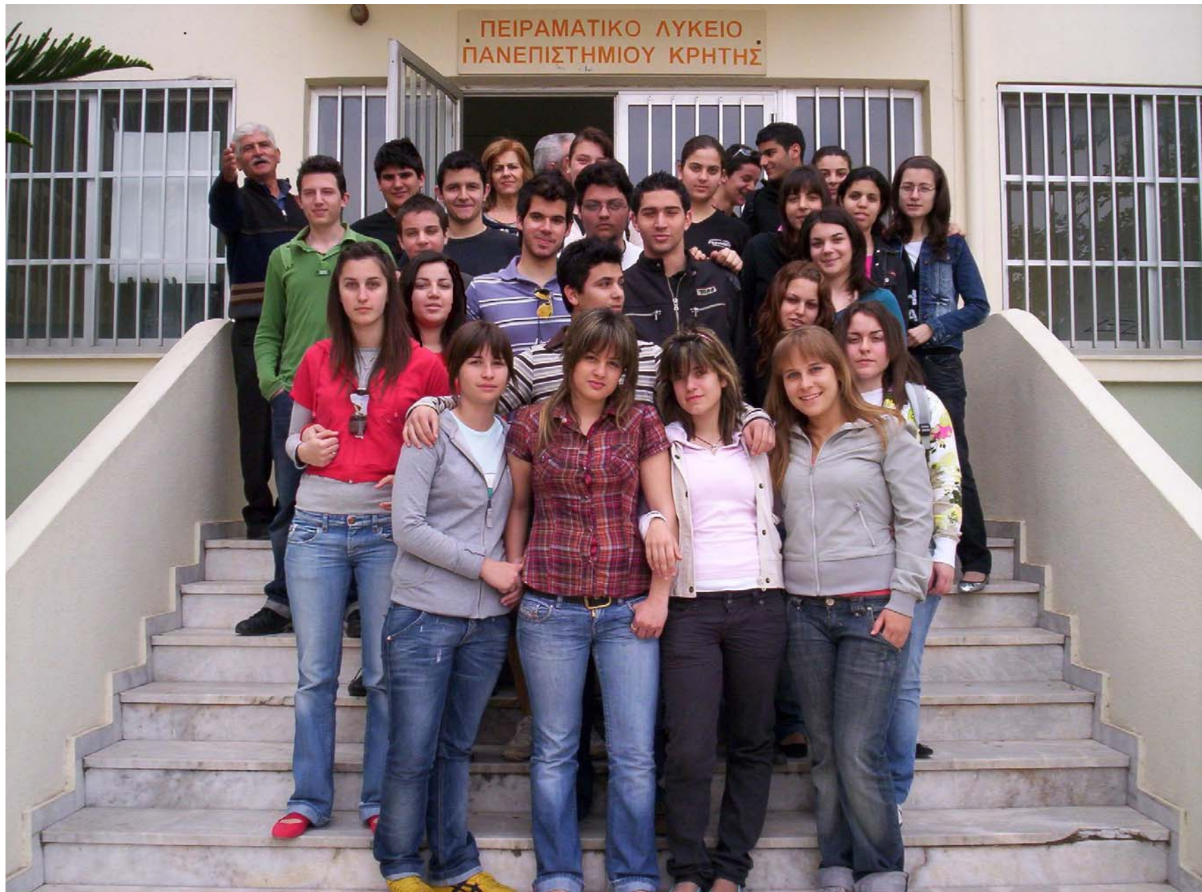
Αναμνηστική φωτογραφία από τα παιδιά του Γ 3.