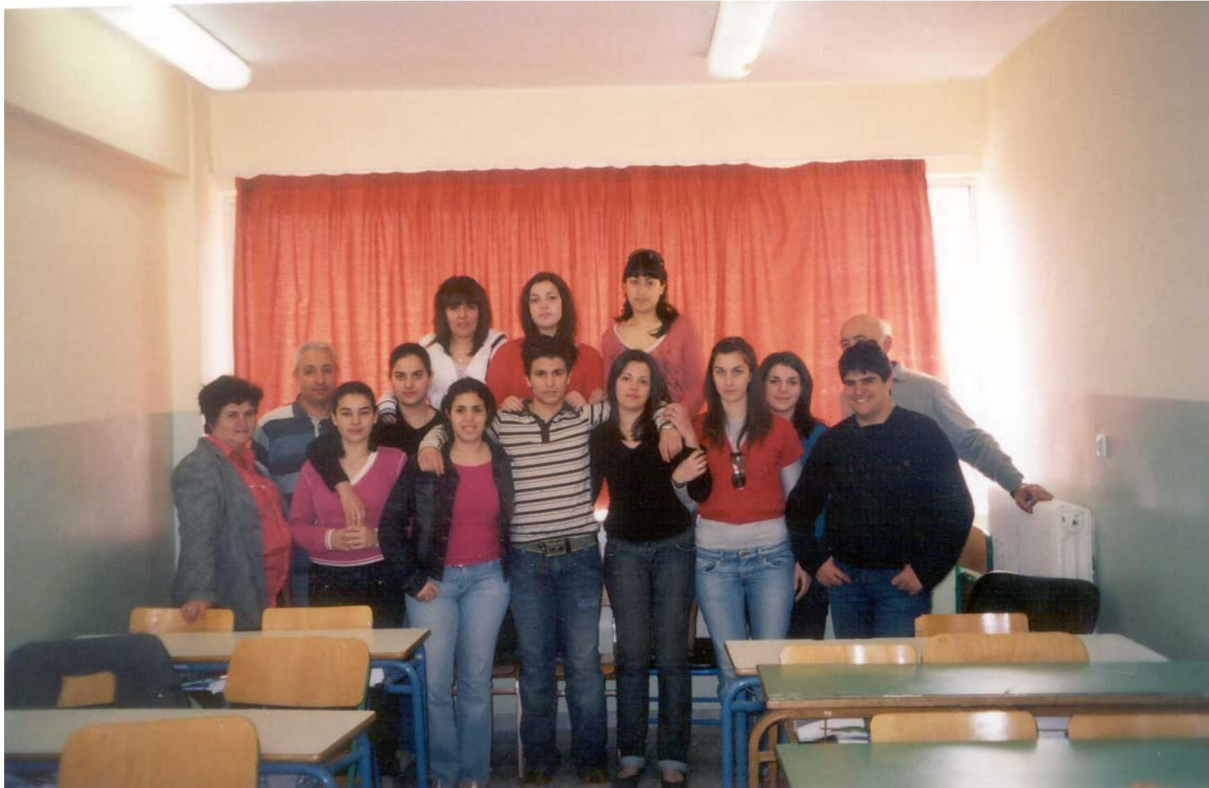
Αναμνηστική φωτογραφία της Θετικής Κατεύθυνσης.