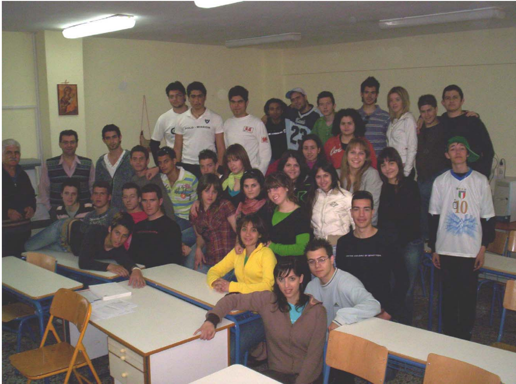
Αναμνηστική φωτογραφία της Τεχνολογικής Κατεύθυνσης.