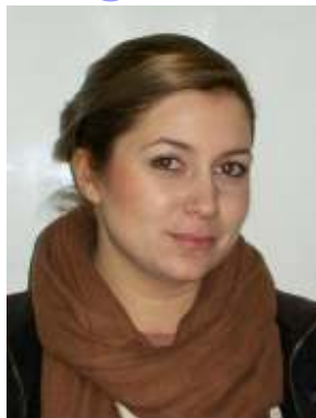
Βαρδαξή Βασιλική - Νιόβη